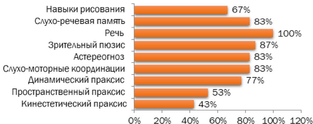
Рис. 1. Нарушения когнитивных функций у исследуемых детей с аутизмом.

Нейропсихологическое исследование включало в себя оценку кинестетического, динамического и пространственного праксиса, слухомоторной координации, стереогноза, зрительного гнозиса, речи, слухоречевую память, рисунка и зрительной памяти.