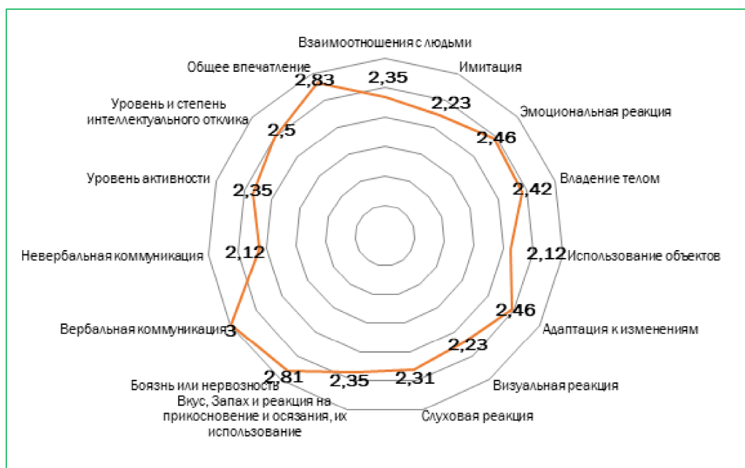
Рис. 2. Оценка состояния детей с РАС по субшкалам CARS.

У 80% детей с РАС отмечалась умеренная степень аутизма и была зарегистрирована в диапазоне 35-37 баллов, у 6 (20%) детей отмечалась тяжелая степень аутизма, эти дети были более старшего возраста. В результате проведенных исследований было установлено улучшение, которое носило в некоторых случаях достоверный характер, но при всех показателях развития детей с РАС отмечалась тенденция к улучшению в основной группе по отношению к группе сравнения (таблица 1.).